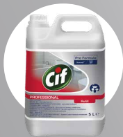
CIF 2IN1 WASHROOM