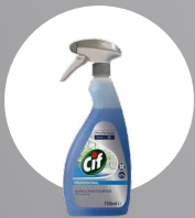
CIF GLASS & MULTI SURFACE