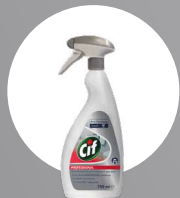
CIF 2IN1 WASHROOM