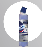
DOMESTOS TOILET CLEANER & DESCALER