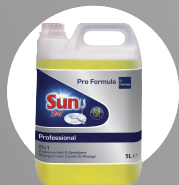
SUN 2IN1 LIQUID