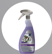
CIF 2 IN 1 KITCHEN CLEANER DISINFECTANT