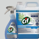
CIF PROFESSIONAL GLAS & UNIVERSALREINIGER